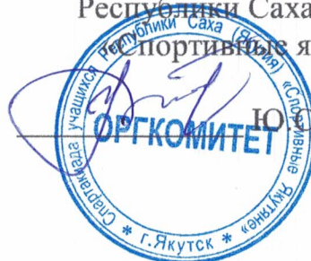
Ю. С. Балаганский

Главный судья Спартакиады учащихся Республики Саха (Якутия) «Спортивные якутяне»